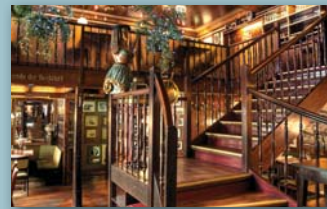
Old Commercial Room